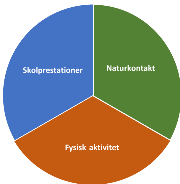
Figur 1. Litteraturgenomgången resulterade i att forskningsmaterialet kunde sorteras i tre huvudkategorier. I kunskapsöversikten redogörs för kunskapsläget utifrån var och en av dessa kategorier, det vill säga utomhusundervisningens effekter på skolprestation, fysisk aktivitet respektive naturkontakt.