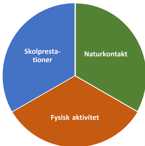
Figur 1. Forskningsmaterialet om effekter av utomhusundervisning har sorterats i tre huvudkategorier.

Litteraturgenomgången resulterade i att forskningsmaterialet kunde sorteras i tre huvudkategorier. I kunskapsöversikten redogörs för kunskapsläget utifrån var och en av dessa kategorier, nämligen utomhusundervisningens effekter på skolprestation, fysisk aktivitet och naturkontakt.