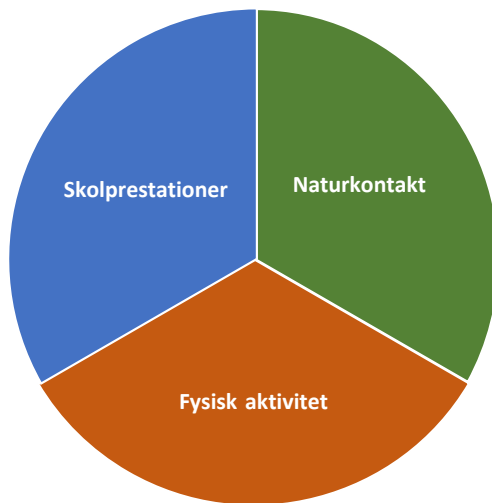
Figur 1. Litteraturgenomgången resulterade i att forskningsmaterialet kunde sorteras i tre huvudkategorier. I kunskapsöversikten redogörs för kunskapsläget utifrån var och en av dessa kategorier, det vill säga utomhusundervisningens effekter på skolprestation, fysisk aktivitet respektive naturkontakt.