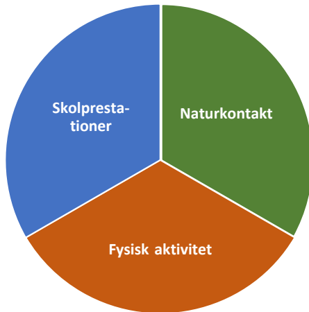
Figur 1. Forskningsmaterialet om effekter av utomhusundervisning har sorterats i tre huvudkategorier.

Litteraturgenomgången resulterade i att forskningsmaterialet kunde sorteras i tre huvudkategorier. I kunskapsöversikten redogörs för kunskapsläget utifrån var och en av dessa kategorier, nämligen utomhusundervisningens effekter på skolprestation, fysisk aktivitet och naturkontakt.